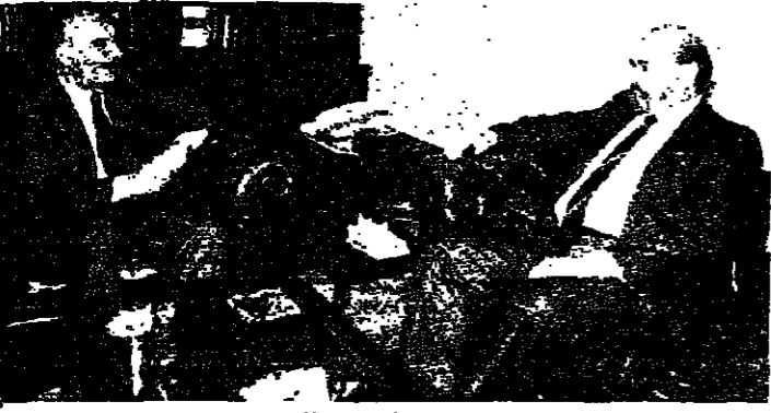
السفير الاسرائيلي (اسماعيل حداد)

اعلن السفير الاسرائيلي يدور امانيويل دو ارستيغبي انه تلقى معلومات دقيقة ومعقدة عن الأوضاع اللبنانية. موضحا انه سيطلع زملاءه في المجموعة الاوربية عليها.